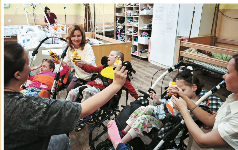
Республика Коми. На мастер-классе по логоритмике

В арсенале специалистов – методики, подтвердившие свою эффективность