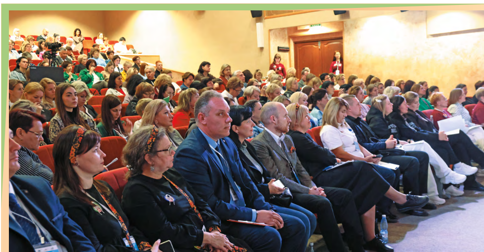
Муниципальная гостиная «Семейноцентричная среда муниципального образования». Заинтересованная аудитория площадки – представители органов местного самоуправления

Какие меры поддержки семьи способны оказать наибольшее влияние на рождаемость? Как учитывать интересы и запросы семей с детьми при разработке государственных и корпоративных стратегий, региональных программ, проектов в сфере социальной, экономической, демографической, жилищной, финансовой, налоговой, политики? Как принцип семейноцентричности может быть «вписан» в программы развития образования, здравоохранения, культуры, цифровой и информационной среды, сферы безопасности? Дискуссия на эти и другие темы, предложенные экспертом, получилась оживленной.