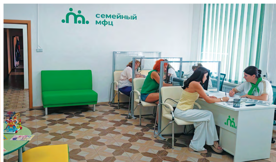
Единый стиль, принятый в оформлении Служб первичного приема и других отделений, делает Семейные МФЦ узнаваемым социальным брендом

Безусловно, в Семейных МФЦ внимательно относятся к семьям с детьми, оказавшимся в трудной жизненной ситуации, включая многодетные семьи, семьи, воспитывающие детей с особенностями развития, – всех тех, кому эффективная