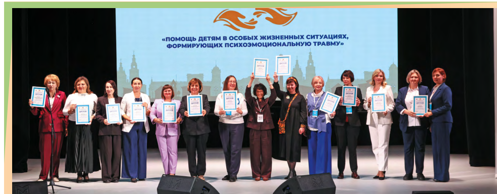
Дипломами профессионального признания в 8 номинациях отмечены 105 лидерских практик

Важной частью программ по поддержке участников СВО и их семей могут и должны стать проекты, направленные на патриотическое воспитание детей и подростков. Такое мнение высказывали специалисты на профессиональной площадке «Мой герой – Защитник Отечества». На ней обсуждались современные форматы мероприятий, в том числе – с привлечением военнослужащих, вернувшихся с передовой, которые интересны для подрастающего поколения и могут быть рекомендованы к тиражированию, а также новые подходы, позволяющие вовлечь в подобные проекты несовершеннолетних «группы риска».