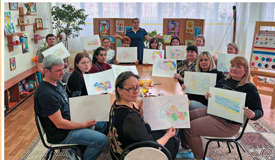
Заинтересованные родители участвуют в тренинге по программе «От принятия – к действию» (Волгоградская область)

зуются популярные и доступные каналы коммуникации. Создан, например, телеграмм-канал «Домашний консультант город Самара». В нем каждый специалист междисциплинарной бригады ведет свой чат, в котором можно задавать вопросы и оперативно получать консультационную помощь. Кроме того, для родителей проведен цикл из 25 вебинаров «Растем и развиваемся вместе: первый год жизни малыша».