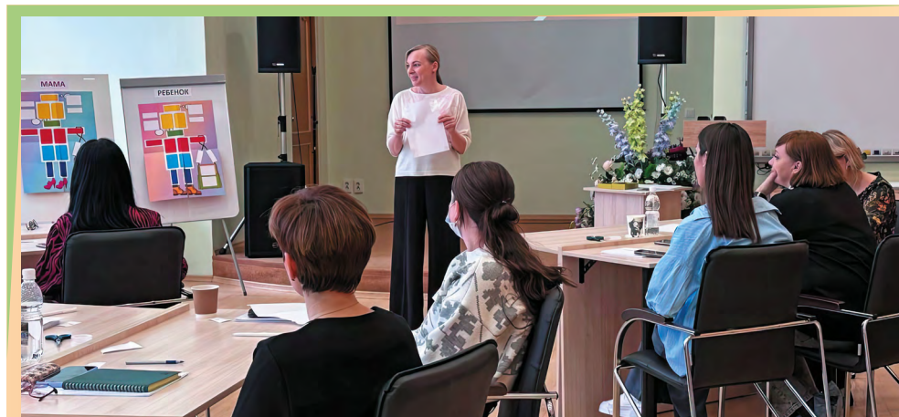
Одно из мероприятий первого дня стажировки – психологическая игра «Портрет в полный рост», на которой разбираются переживания детей и родителей в конфликте

пройти профессиональную переподготовку в Москве.