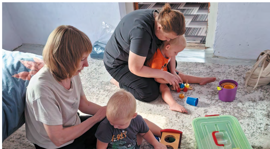
Специалисты службы ранней помощи «Домашний консультант» (Самарская область) проводят на дому комплексное занятие для братьев-двойняшек. Малыши с удовольствием выполняют игровые задания

социального проката, где можно на время получить в безвозмездное пользование различные игрушки и развивающие комплексы.