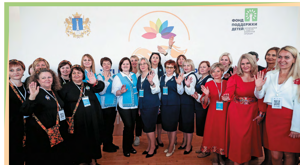
XVI Всероссийский форум «Вместе – ради детей! Быть рядом!» Старт дан!

специалистов-практиков, ежедневно работающих с главными адресатами заботы и внимания – с детьми и их семьями. Впрочем, к темам, включенным в повестку Форума, мы обратимся далее. Пока же констатируем факт: идея сразу окунуться в рабочий процесс получила живой отклик и каждая из профплощадок собрала заинтересованную аудиторию, открытую к конструктивному диалогу. А главное – работа на профессиональных площадках позволила делегатам из разных регионов настроиться на общую волну и ощутить себя настоящей командой единомышленников.