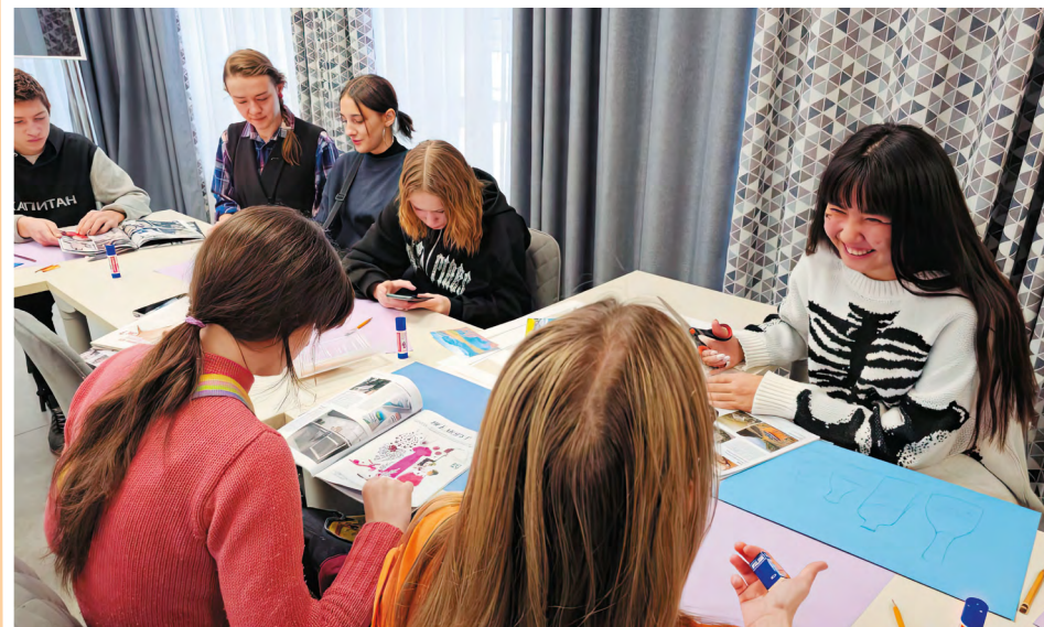
Тюменская область. Встреча на площадке «АртЛифт»

дискомфорт в ситуациях, требующих активного взаимодействия со сверстниками и взрослыми. Для таких детей специалисты социально-реабилитационного центра «Семья» разработали программу «АртЛифт». Она представляет собой