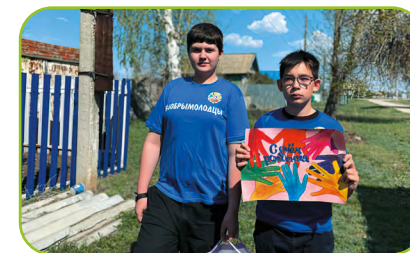
Юные добровольцы из Саратовской области

Активисты детского добровольческого движения придумывали специальные поздравления для маломобильных сверстников, приносили им на дом в день рождения подарки, сделанные своими руками, организовывали костюмированные интерактивы на праздники.