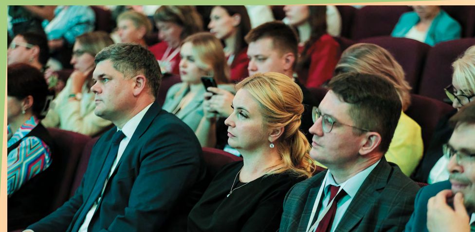
Всероссийское совещание «Новый формат помощи семьям с детьми – Семейный многофункциональный центр». На площадке состоялось заинтересованное обсуждение актуальных направлений развития этого масштабного проекта Минтруда России и Фонда поддержки детей

Как развивается проект по созданию сети Семейных МФЦ, какую роль он играет в реализации семейной и демографической политики? В чем особенность модели работы Семейных МФЦ? Какова специфика профессиональной деятельности куратора семьи? Как кураторы выстраивают программу сопровождения семей, проживающих не в городе, где расположен Семейный МФЦ, а на «прикрепленной территории»? Как организуют в Семейных МФЦ работу с обращениями граждан по принципу «одного окна», какие информационные сервисы и системы позволяют реализовать «бесшовный» маршрут сопровождения? Как выстраивается межведомственное взаимодействие в интересах семей? Как сотрудники Семейных МФЦ привлекают к партнерству в оказании