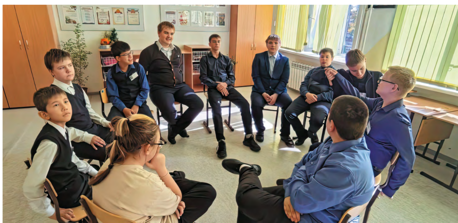
Иркутская область. Работа Школьной службы медиации. Подростки осваивают практику «Круги сообществ»

мер уделялось популяризации восстановительных практик. Форматы для этого были выбраны разные. К примеру, среди учащихся 7-11 классов провели Региональную дистанционную олимпиаду по медиации «Я с тобой». Ее задачей было выявить активных школьников, участвующих в работе служб медиации, с тем чтобы развить у них умение проводить примирительные программы и оказать содействие в дальнейшей профессиональной подготовке в области медиации, психологии, юриспруденции.