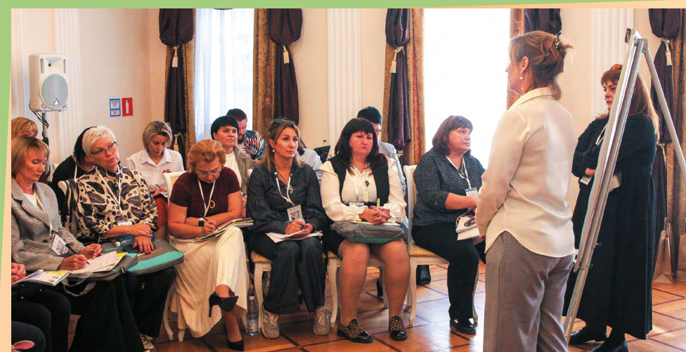
«Лаборатория профессионалов. Сохранение семьи для ребенка в ситуации алкогольной зависимости родителей»

все то, что необходимо для подготовки к активной самостоятельной жизни.