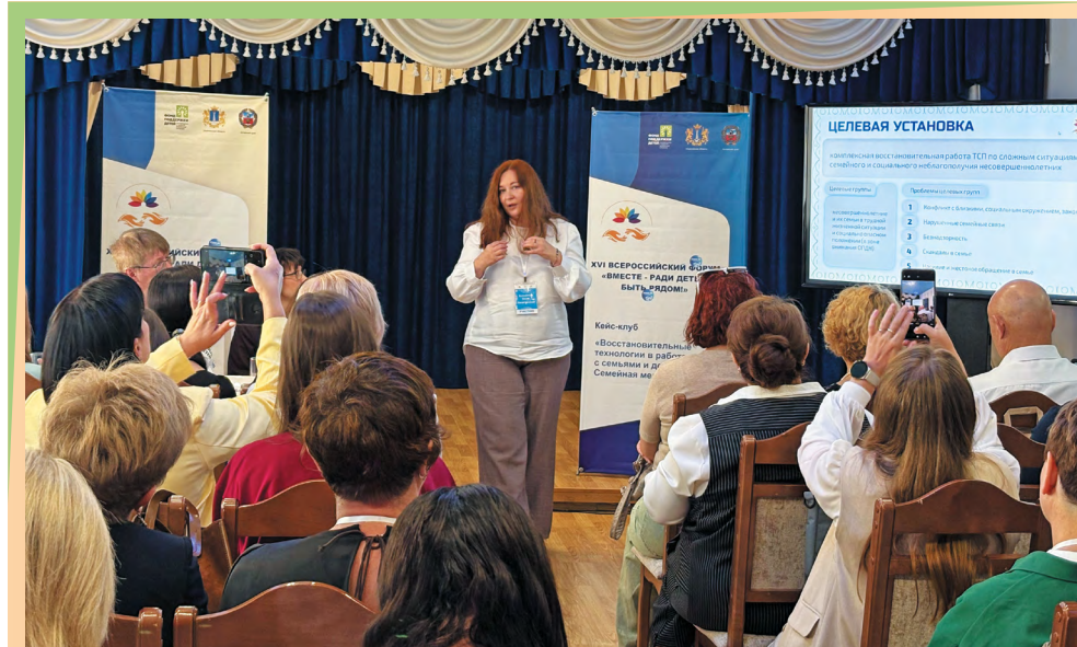
Кейс-клуб «Восстановительные технологии в работе с семьями и детьми». Специалисты обсуждают практические алгоритмы проведения процедур медиации