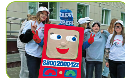
Юные добровольцы из Курганской области

Школьники-волонтеры создали для ребят, находящихся в трудной жизненной ситуации, сборник терапевтических аудиосказок, распространяли среди сверстников флаеры, буклеты, листовки о возможности получения экстренной психологической помощи по детскому телефону доверия 8-800-2000-122 и короткому номеру 124.