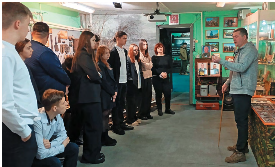
В музее отряда «Подвиг» подростки с интересом слушали рассказ о работе поисковиков, рассматривали найденные ими трофеи

гулярно организуют показы фильмов исторической, военной тематики: «Сын полка», «Иди и смотри», «Ванька», «Небо»... Подростки, затаив дыхание, смотрят такие картины, а потом горячо обсуждают сюжеты и героев – рано повзрослевших мальчишек и девчонок, которые занимали место своих воюющих отцов в доме, в поле, за станком.