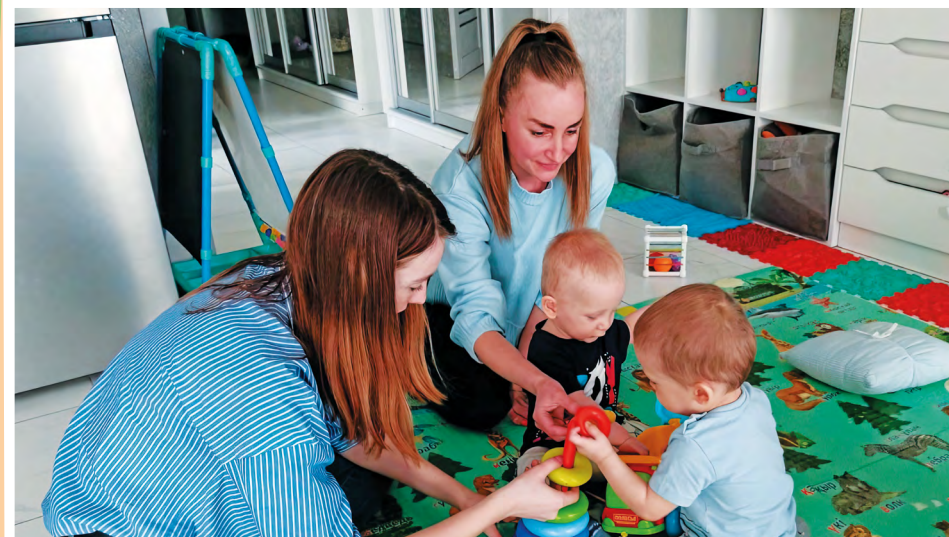
Вместе со специалистами службы «Домашний консультант» (Новосибирская область) дети осваивают игры, направленные на взаимодействие и коммуникацию

Основной акцент специалисты делают на обучении родителей правильному уходу за ребенком, общению с ним, созданию продуктивной развивающей