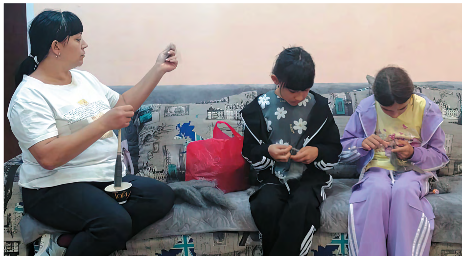
Девочки вместе с мамами в «Семейной мастерской» учатся обрабатывать и прясть пух, вязать кайму, чтобы создать легендарные оренбургские пуховые платки, а еще шапки и шарфы, с которыми не страшен мороз

Параллельно участники проекта осваивали ремесла. На занятиях по про-