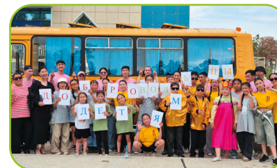
Добровольческое движение в Республике Саха (Якутия)

Юные добровольцы в течение года проводили акции по поддержке детей, находящихся на длительном лечении и реабилитации. Ребята участвовали в сборах и передаче подарков, организовывали творческие мастер-классы, устраивали тематические флешмобы, готовили рисунки и письма поддержки.