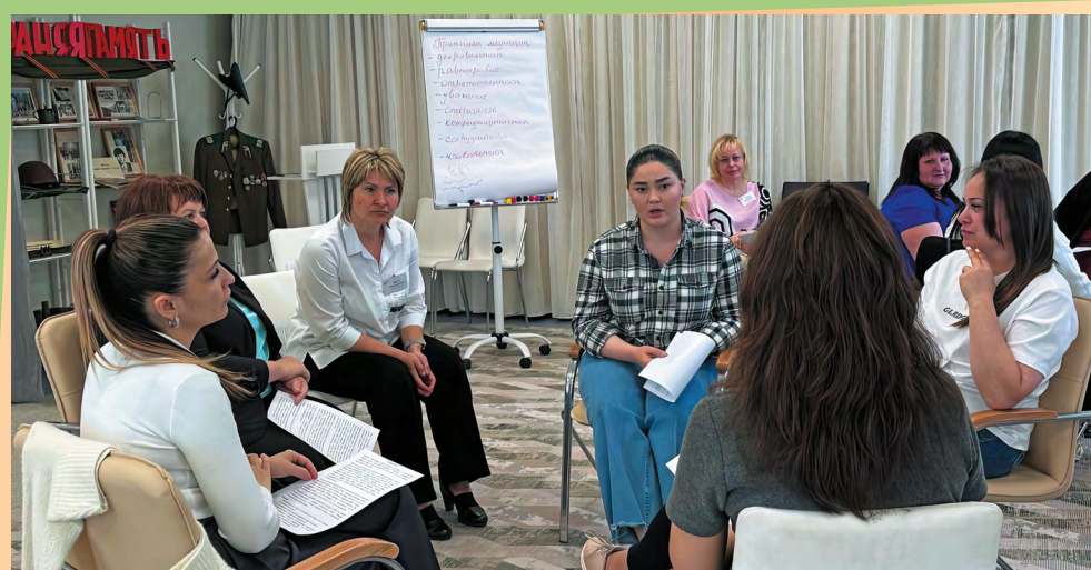
В Центре «Наши дети» (город Череповец) разбираются кейсы из практики работы Службы примирения

В этом же модуле делимся опытом проведения информационно-просветительской кампании. Обязательно отмечаем нюансы сотрудничества с телевизионными и радиокомпаниями, с органами опеки, отделами ЗАГС и другими партнерами. Это очень важная часть работы, поскольку семьи, как показывает практика, мало знают о том, что такое медиация и чем она может помочь.