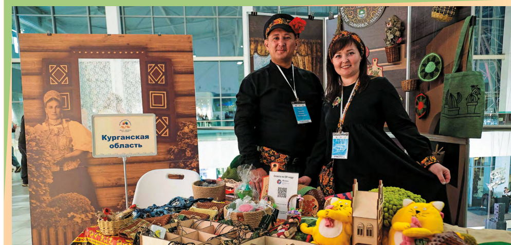
На выставке-ярмарке, организованной в дни Всероссийского форума, были представлены эксклюзивные изделия, созданные детьми и взрослыми в «Семейных мастерских»

«Институт Уполномоченных по правам ребенка реализует программы всесторонней поддержки родителей с детьми. Многие проекты мы осуществляем в партнерстве с Фондом поддержки детей. Мы ведем совместную работу по расширению сети центров дневного пребывания для детей с инвалидностью и их семей, а также открытию служб «Дети в семье», кризисных центров. Мы видим, что создание такой помогающей инфраструктуры востребовано по всей стране. Это важное условие для того, чтобы вернуть детям семейное окружение. Данным вопросом наш правозащитный институт продолжит заниматься в рамках деятельности Всероссийской службы помощи семьям, которую мы создаем по поручению Президента. Важно, чтобы к большой работе присоединились все региональные ведомства, социально ответственный бизнес и некоммерческие организации. Только вместе мы сможем создать эффективную систему помощи семьям с детьми по преодолению сложных жизненных обстоятельств».