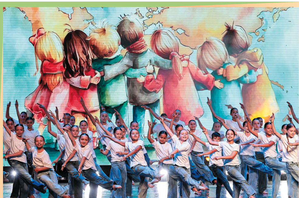
Замечательным подарком для участников Форума стало выступление на церемонии открытия юных воспитанников школы танцев DanceAvenue

нии эффективности подходов к работе с семьями и детьми, приводя примеры успешного регионального опыта, выступающие были едины во мнении: оказывать материальную поддержку семье, столкнувшейся с жизненными трудностями, совместно и оперативно решать конкретные бытовые проблемы необходимо. Но это только первый шаг. Для специалистов важно глубоко понимать сложные ситуации, в которых могут оказаться семьи с детьми. Понимать и быть готовыми вместе с семьей до конца пройти через любую такую ситуацию. Не упрекая, а предлагая путь, помогая семье находить и использовать собственные возможности для преодоления проблем.