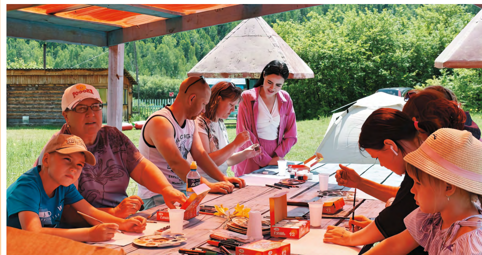
Семейный клуб в городе Петровске-Забайкальском. В кемпинге, организованном на базе оздоровительного лагеря «Металлург», для участников проекта были предложены увлекательные творческие мастер-классы

По сути, Семейный клуб – это современный социальный сервис, ориентированный на стабилизацию ситуации в семье и преодоление кризиса детско-родительских отношений. Для семей целевой группы разрабатываются программы, включающие консультации