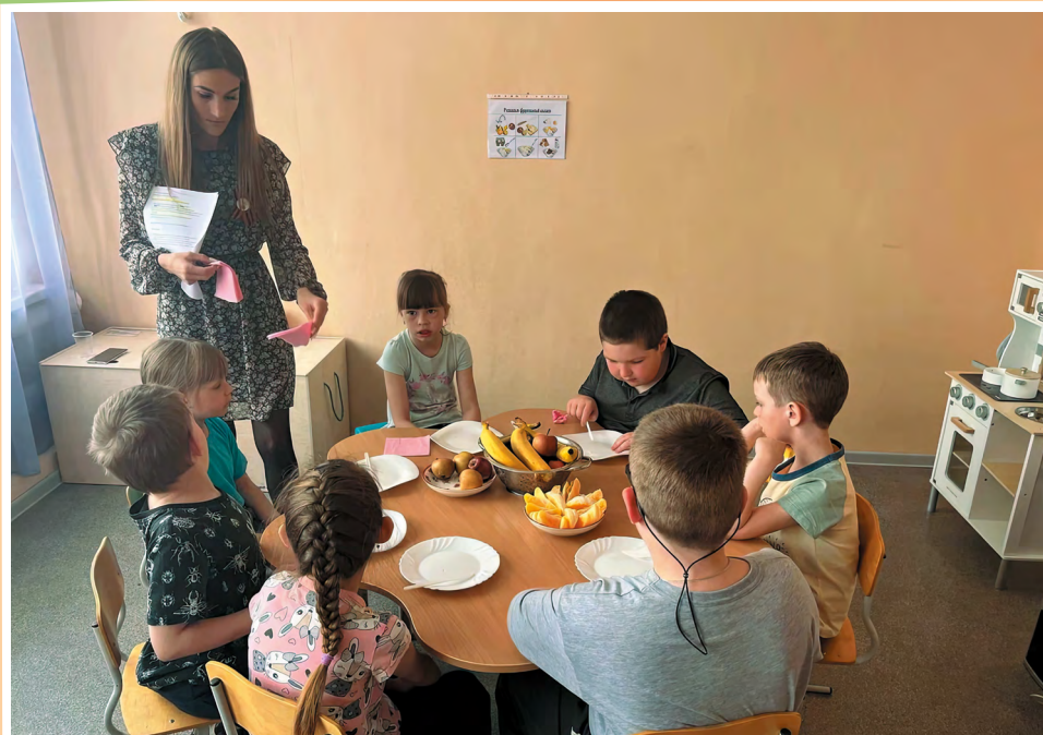
Омская область. Занятия в комнате социально-бытовой адаптации. Дети осваивают рецепты приготовления элементарных блюд и правила поведения за столом

Успешный опыт такой работы есть в Омской области, например, в Колосовском районе. Там на базе Комплексного центра социального обслуживания населения оборудована комната социально-бытовой адаптации. На занятиях, которые в ней проводят педагоги, дети учатся самостоятельно управляться с нижним бельем, колготками и носками, верхней одеждой, го-