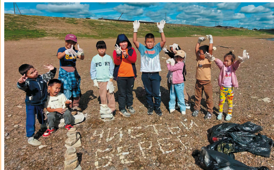
Юные участники акции «Чистый берег» довольны своей работой

Отдых в летнем лагере тоже наполнен не одними лишь развлечениями. Так, в рамках смены «Лето с пользой» была