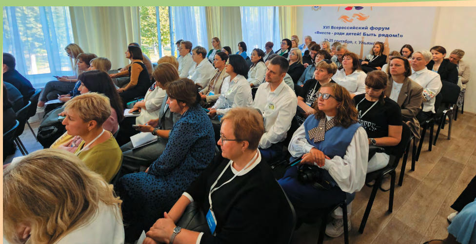
Диалоговая площадка «Помощь детям в особых жизненных ситуациях, формирующих психоэмоциональную травму». В фокусе внимания специалистов – коррекционные и реабилитационные практики, подтвердившие свою эффективность

просто необходимо владеть арсеналом коррекционных практик, помогающих пострадавшему ребенку справиться с таким состоянием. Мощным стимулом к тому, чтобы изучать подобные практики и внедрять их в работу, стало и то, что старт Комплекса мер года пришелся на время тяжелых событий на приграничных территориях Курской области. Мы как ближайшие соседи просто не могли остаться в стороне, и забота о детях с психоэмоциональной травмой стала общей задачей для всех без исключения специалистов».