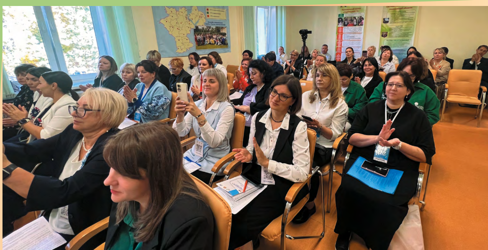
Площадка, посвященная программам ранней помощи. Одна из тем заинтересованного диалога – развитие выездных служб «Домашний консультант»

Домашнего микрореабилитационного центра. Большое внимание в ходе открытого диалога было уделено реализации в регионах проекта Фонда по созданию выездных служб «Домашний консультант» 1 , благодаря которым помощь специалистов приходит в семьи, не имеющие возможности регулярно получать реабилитационно-коррекционные услуги в социальных учреждениях. Успешным опытом работы с коллегами поделились руководители центра «Доверие» города Салехарда (ЯНАО), многопрофильного центра «Семья» (Нижний Новгород), Кемеровского реабилитационного центра «Фламинго», в структуре которых созданы такие службы.