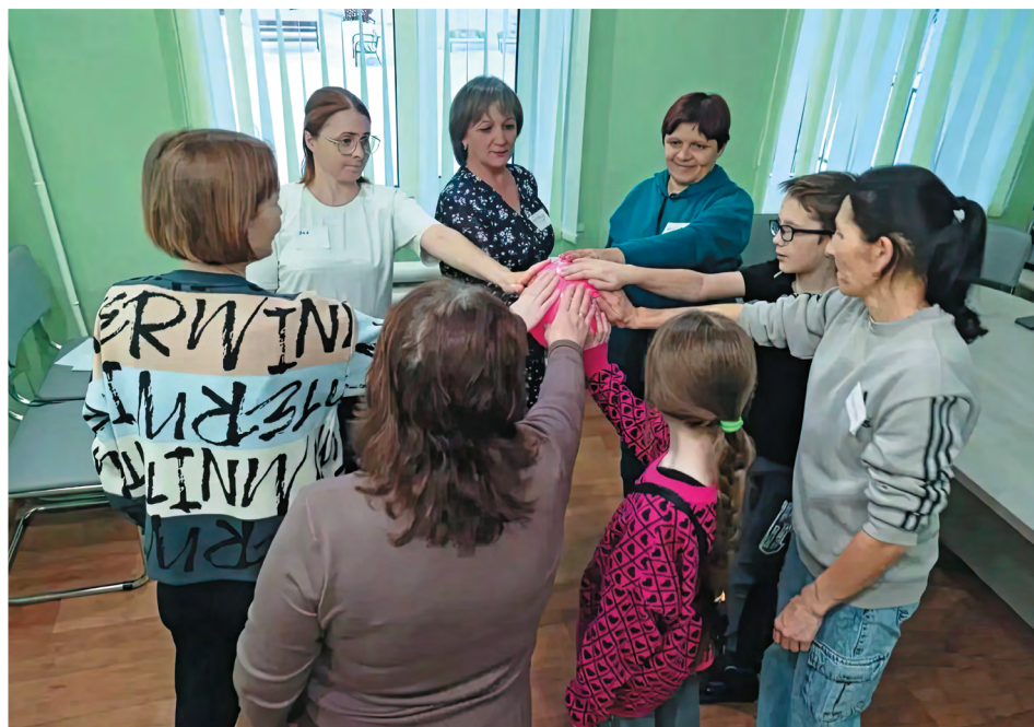
Томская область. Практикум на тему взаимоотношений с детьми включает командообразующие игры и упражнения

и детям Асиновского района, работает «Школа осознанного родительства». Она предлагает не просто серию лекций, а комплексную программу, призванную поддержать родителей на всех этапах взросления ребенка. Занятия проходят в атмосфере заинтересованного обмена знаниями и практическими навыками по воспитанию детей. На интерактивных мастер-классах педагоги знакомят пап и мам с особенностями интеллектуального развития, поведения и психоэмоциональных реакций ребенка в разном возрасте, рассказывают о кризисных периодах и возможностях их преодоления.