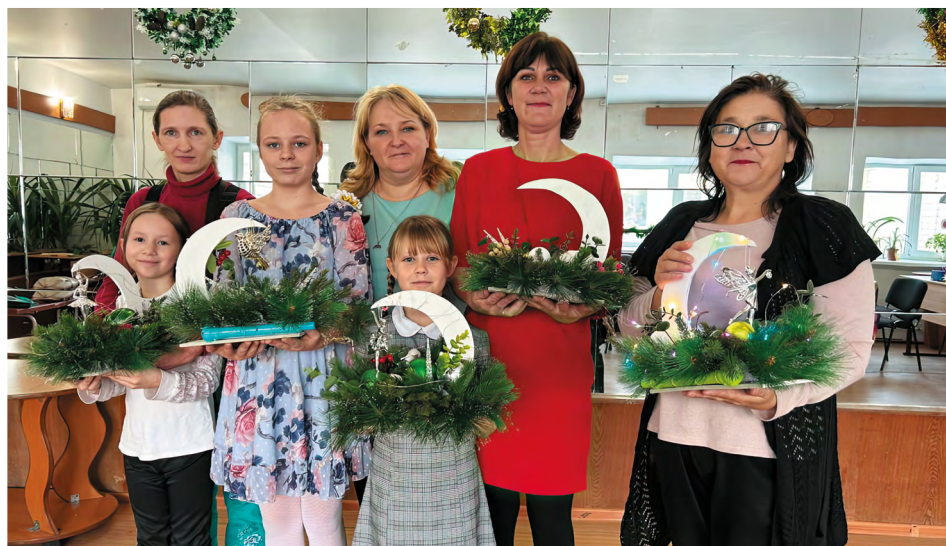
Большой популярностью у взрослых и юных участников проекта пользуются мастер-классы по изготовлению интерьерного декора из искусственной ели

и обработки фотографий, обучались работе с ламинатором и брошюратором, изготавливали блокноты и фотоальбомы. Большой популярностью у взрослых и юных участников проекта пользовались занятия по парикмахерскому искусству, проведению семейных фотосессий, мастер-классы по оформлению елочных шаров в технике «пэчворк», изготовлению интерьерного декора из искусственной ели, детских украшений для волос, подарков и сувениров. Эксклюзивные изделия, созданные в «Семейной мастерской», стали настоящим украшением многих выставок-ярмарок. Ведь это важно, когда результаты твоей работы интересны другим людям.