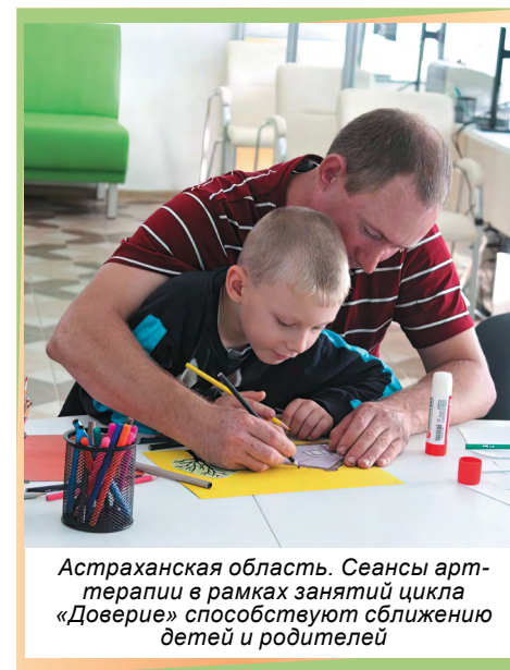
Астраханская область. Сеансы арт-терапии в рамках занятий цикла «Доверие» способствуют сближению детей и родителей

В Семейном МФЦ, вошедшем в структуру Комплексного центра социального обслуживания населения Икрянского района, для семей с детьми предлагаются мероприятия, предупреждающие затруднения и вопросы, которые могут возникнуть у родителей. К примеру, в рамках социального сервиса «Добрый доктор» проводятся занятия под общим названием «Здоровье малыша», которые становятся для молодых мам с новорожденными дополнительным источником ценной информации. Привлеченные в рамках межведомственного сотрудничества к партнерству с Семейным МФЦ медицинские работники проводят консультации по основным правилам и нормам ухода за младенцами, режиму грудного вскармливания, гигиеническим проце-