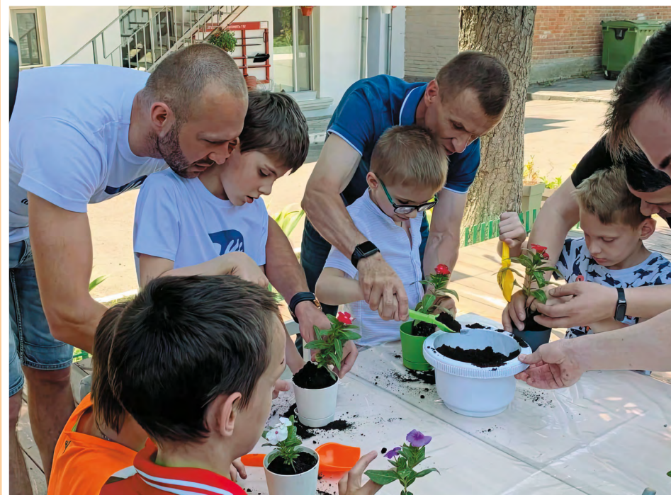
Ростовская область. Занятие в клубе «Папа особого ребенка»

Организуют специалисты Семейного МФЦ участие семей в просветительских мероприятиях, проводимых и вне центра. Например – в «Родительской гостиной» при Уполномоченном по правам ребенка в Томской области. Одна из онлайн-лекций на этой площадке была посвящена возрастным особенностям подростков, а также эффективным формам родительской поддержки, способствующим развитию у них самостоятельности и ответственности.